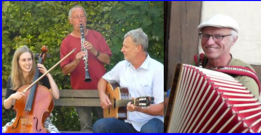
„Musik und Poesie“